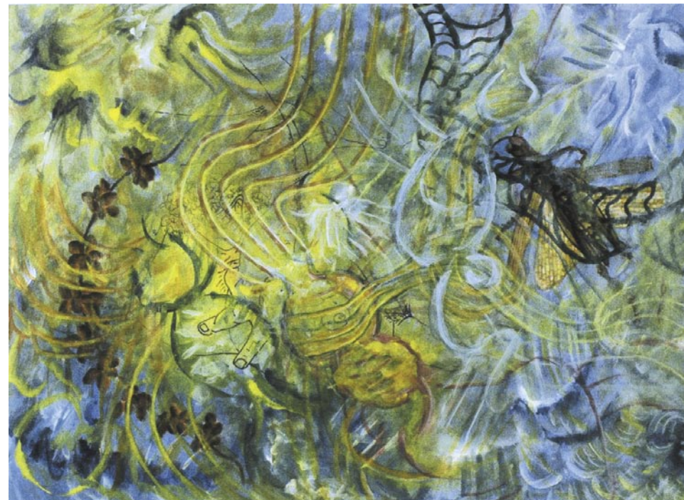
Mojacar's Grasshopper / acrílico sobre papel / 22.9 x 30.5 m / 2005