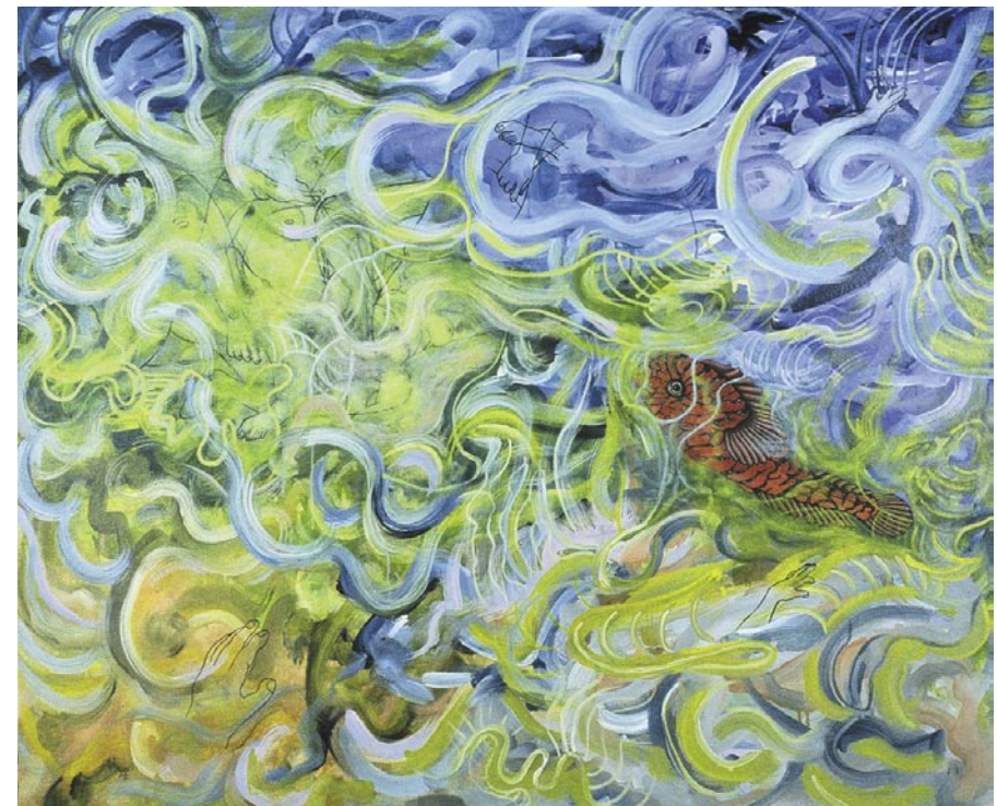
Northern Clingfish / acrílico sobre tela / 119.3 x 144.7 m / 2005

engaños / tropiezos para encontrar la sinceridad. / La vida retoña / nuevos comienzos. / Todavía, después de tantos años / el olor de esos animalitos / habitantes en