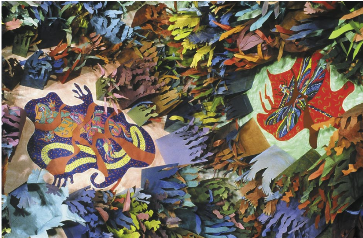
Canto a la fauna 6 (detalle) / medios mixtos / 3657 m 2 / 2001