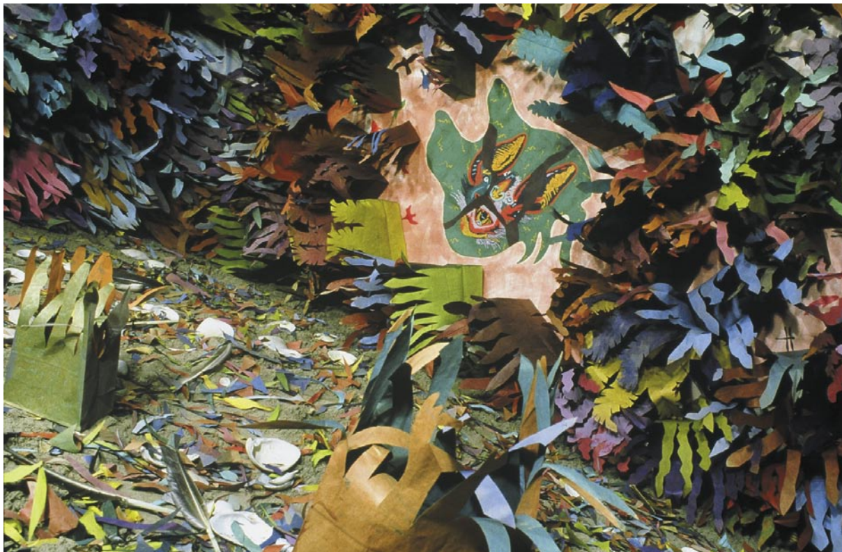
Canto a la fauna 4 (detalle) / medios mixtos / 3657 m 2 / 2001 Canto a la fauna 2 (detalle) / medios mixtos / 3657 m 2 / 2001 ◀

Momentos de soledad / entre papeles y memorias / fotos que marcan otro tiempo / amores perdidos como montaña / de caracolas en la ventana de mi baño / animal-