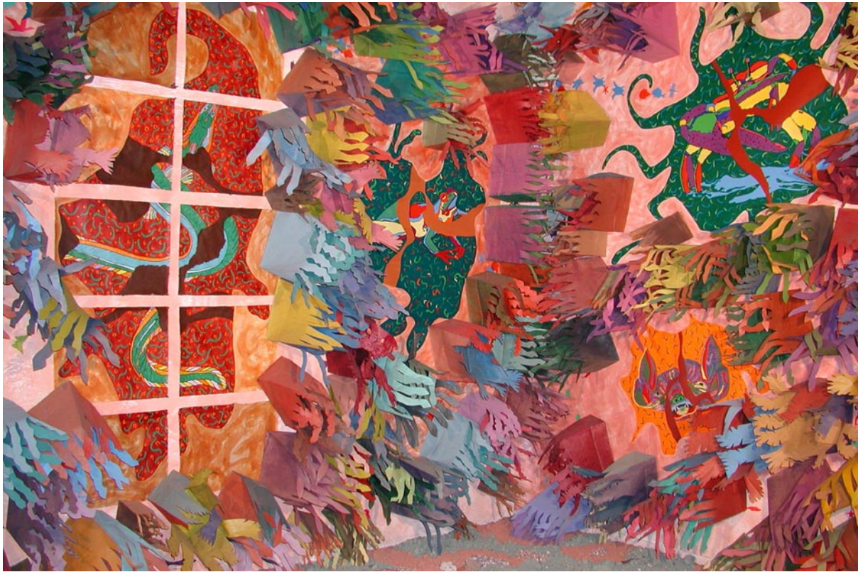
Canto a la fauna americana (detalle) / medios mixtos / 54.8 x 43.9 x 11 m / 2002