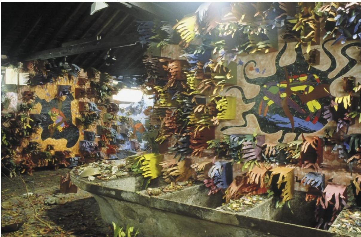
Natura-Frágil 1 (detalle) / medios mixtos / 8.2 x 14.6 x 202 m / 1999 Canto a la fauna 5 (detalle) / medios mixtos / 3657 m 2 / 2001 ◀