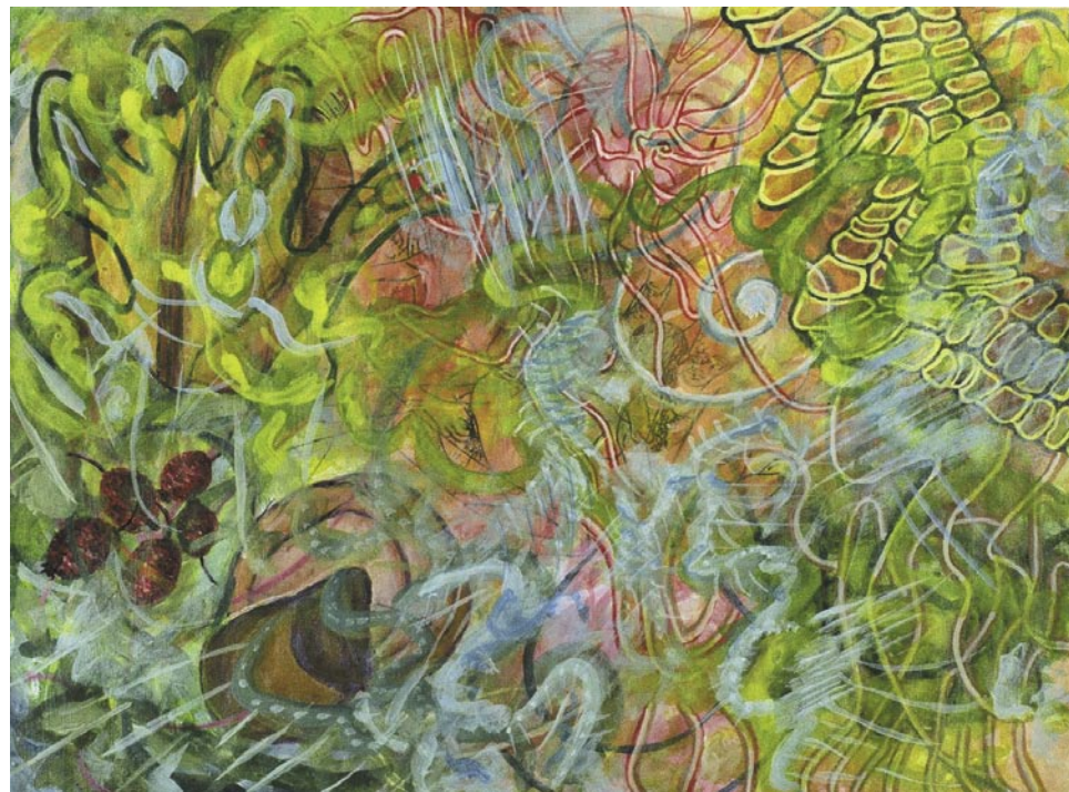
Berries and seeds / acrílico sobre papel / 22.9 x 30.5 m / 2005