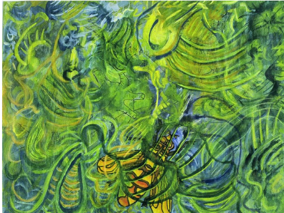
Flower Fly / acrílico sobre papel / 22.9 x 30.5 m / 2005