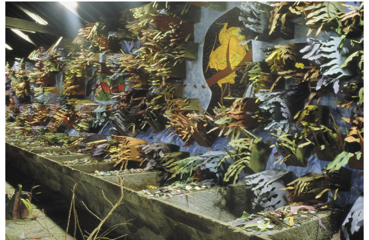
Natura-Frágil 2 (detalle) / medios mixtos / 8.2 x 14.6 x 202 m / 1999