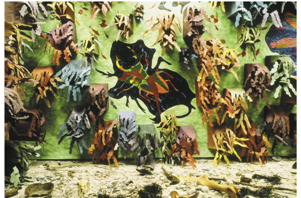
Endangered (detalle) / medios mixtos / 9.1 x 21 x 84.1 m / 1998

tos honestos / que habitaron en cada concha / pedacitos de vida como la mía / hoy / extinguiéndose / viviendo el pasado, / presente y futuro perdidos / ;no sé dónde! /