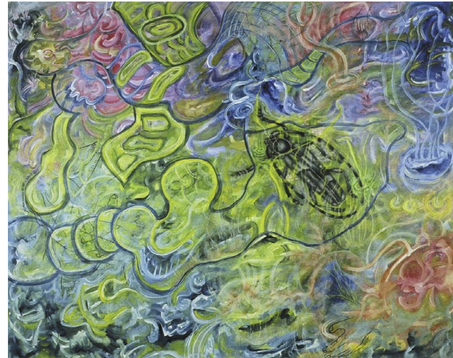
The Way of the Long-Horned Borer / acrílico sobre tela / 124.4 x 152.4 m / 2005