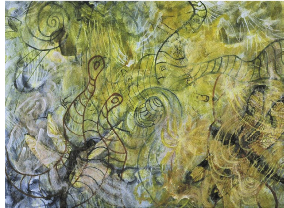
Dragonflies / acrílico sobre papel / 22.9 x 30.5 m / 2005