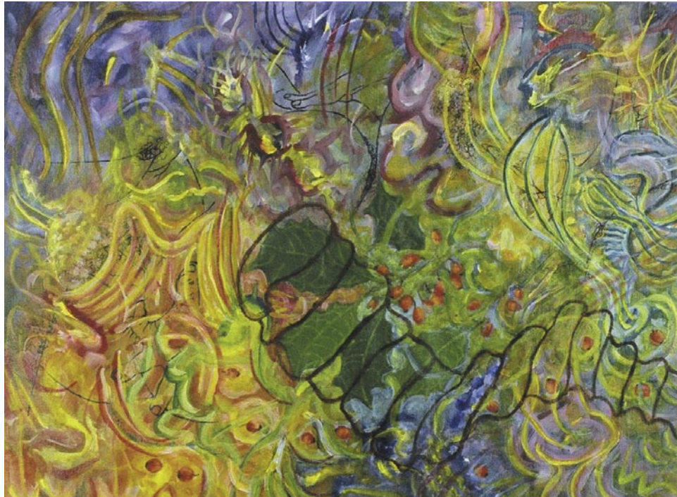
Winter Berries / acrílico sobre papel / 22.9 x 30.5 m / 2005