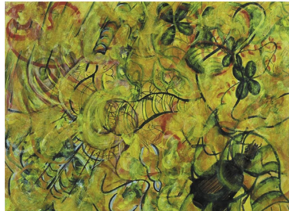
Beetle with snail / acrílico sobre papel / 22.9 x 30.5 m / 2005

refleje la realidad. / Puede vivir el mundo entero / dentro del agujero de un caracol. / Arañas pequeñísimas / tratan de ocultar su morada / ahogándose en la bañera.