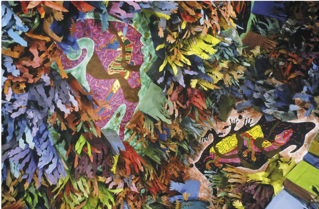
Canto a la fauna 3 (detalle) / medios mixtos / 3657 m 2 / 2001