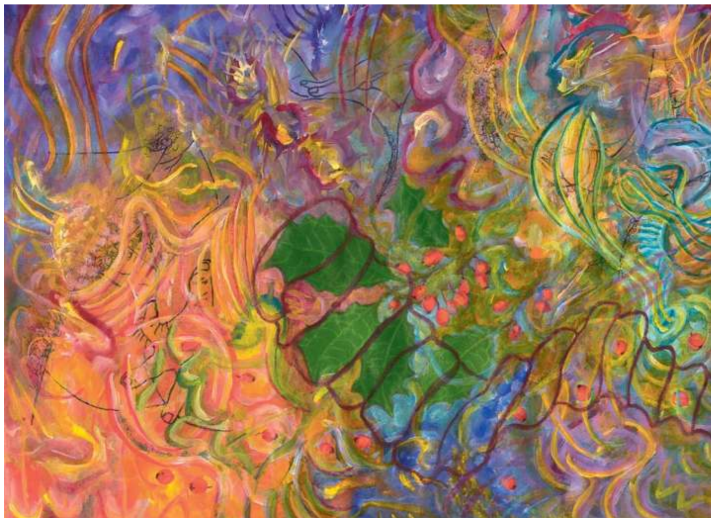
Winter Berries (Moras de invierno), 2005. Acrílico sobre papel, 23 x 30.5 cm