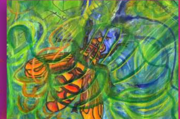
Detalle: Flower Fly (Mosca de flor)