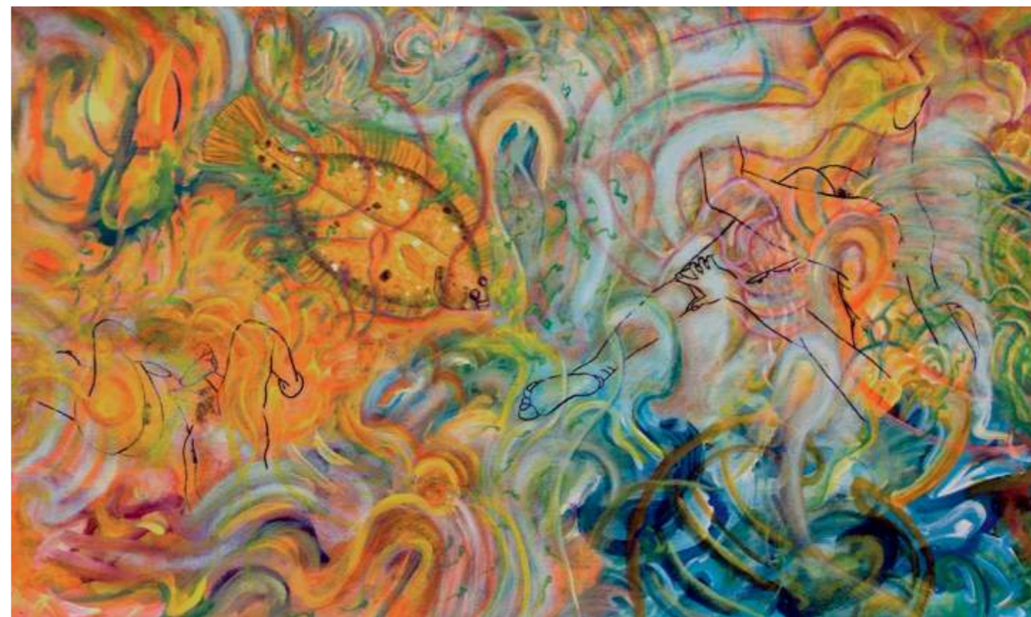
Winter Flounder (Lenguado), 2005. Acrílico sobre papel, 56 x 94 cm