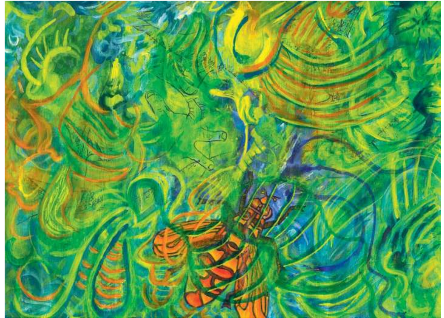
Flower Fly (Mosca de flor), 2005. Acrílico sobre papel, 23 x 30.5 cm