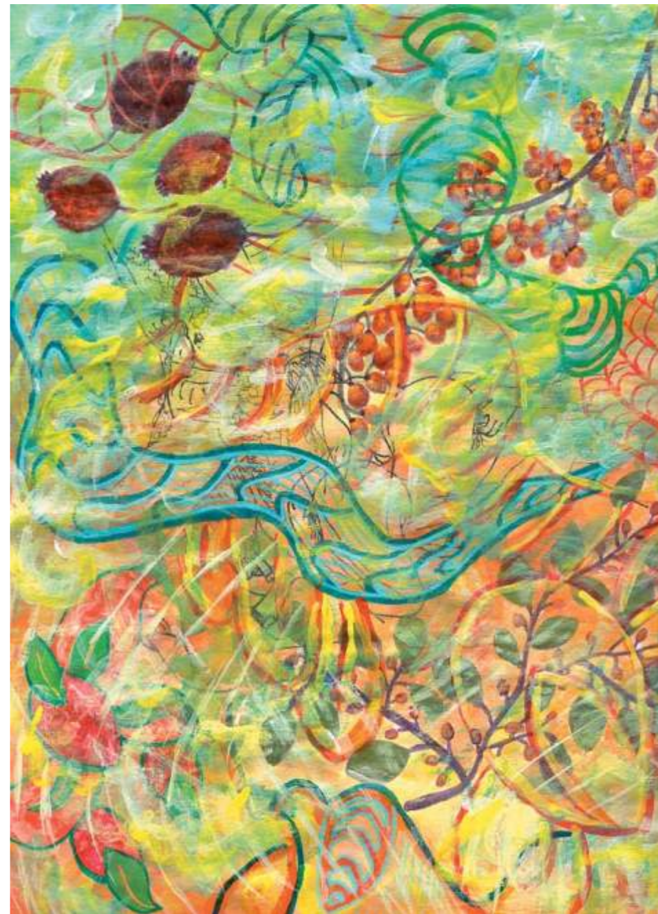
Leafstalks and Berries (Pecíolos y moras), 2005. Acrílico sobre papel, 30.5 x 23 cm