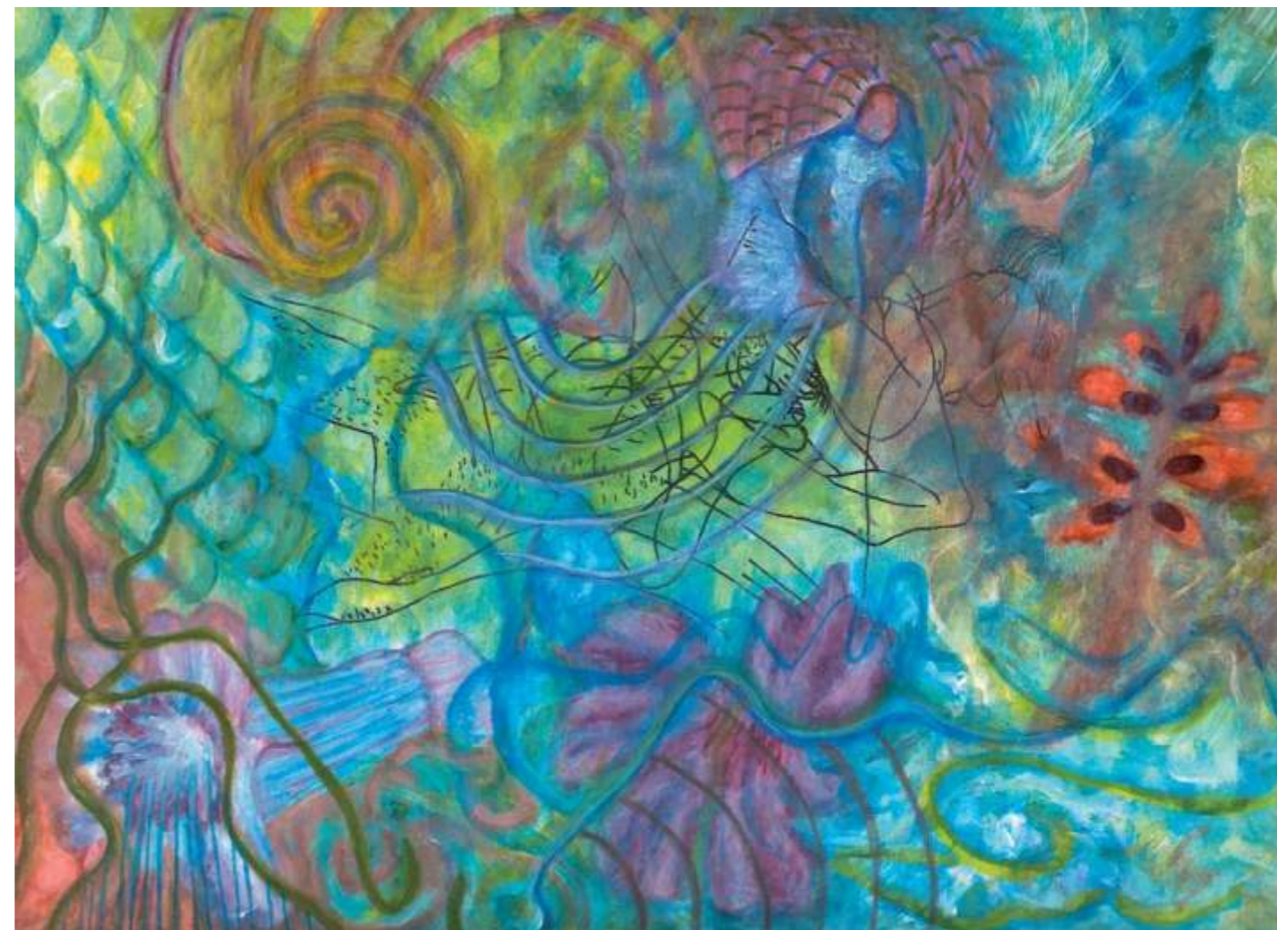
Flowers with Petiole (Flores con pecíolo), 2004. Acrílico sobre papel, 23 x 30.5 cm