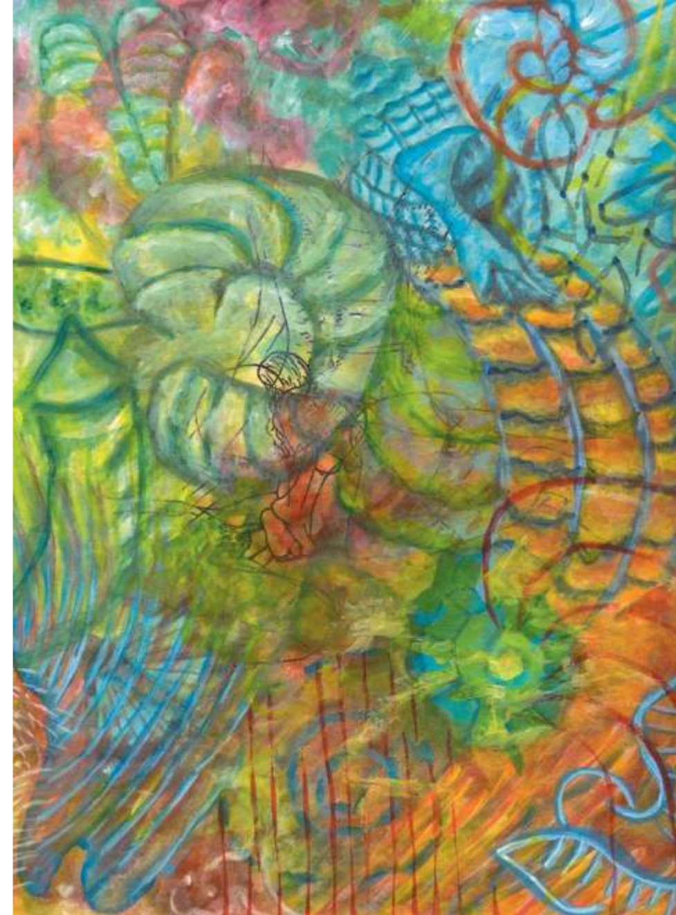
Grasshopper with Seashells (Chapulín con conchas marinas), 2004. Acrílico sobre papel, 30.5 x 23 cm