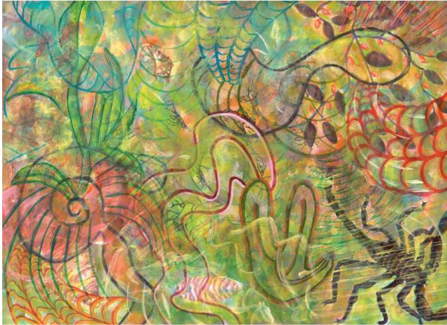
New York's Scorpion (Escorpión de Nueva York), 2005. Acrílico sobre papel, 23 x 30.5 cm