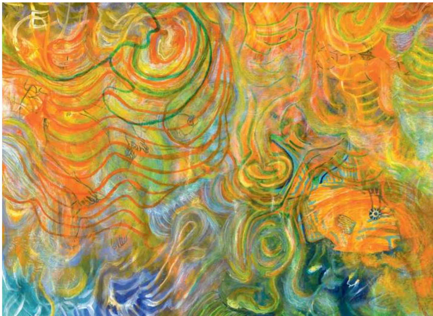
Queen Triggerfish (Pez ballesta), 2005. Acrílico sobre papel, 23 x 30.5 cm