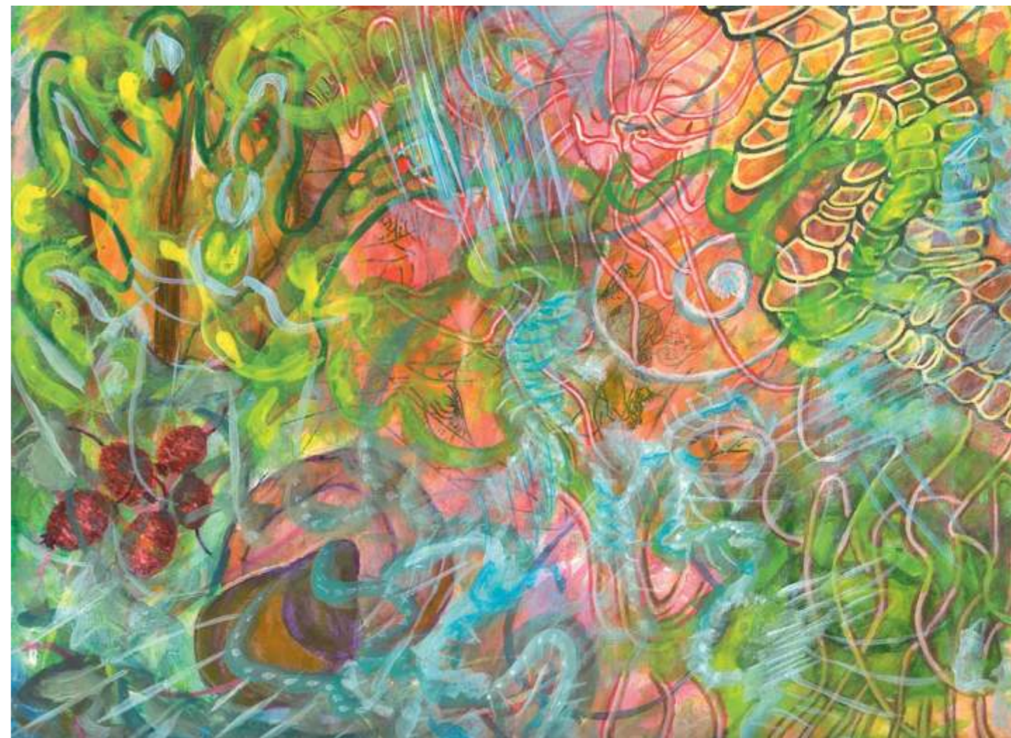
Berries and Seeds (Moras y semillas), 2005. Acrílico sobre papel, 23 x 30.5 cm