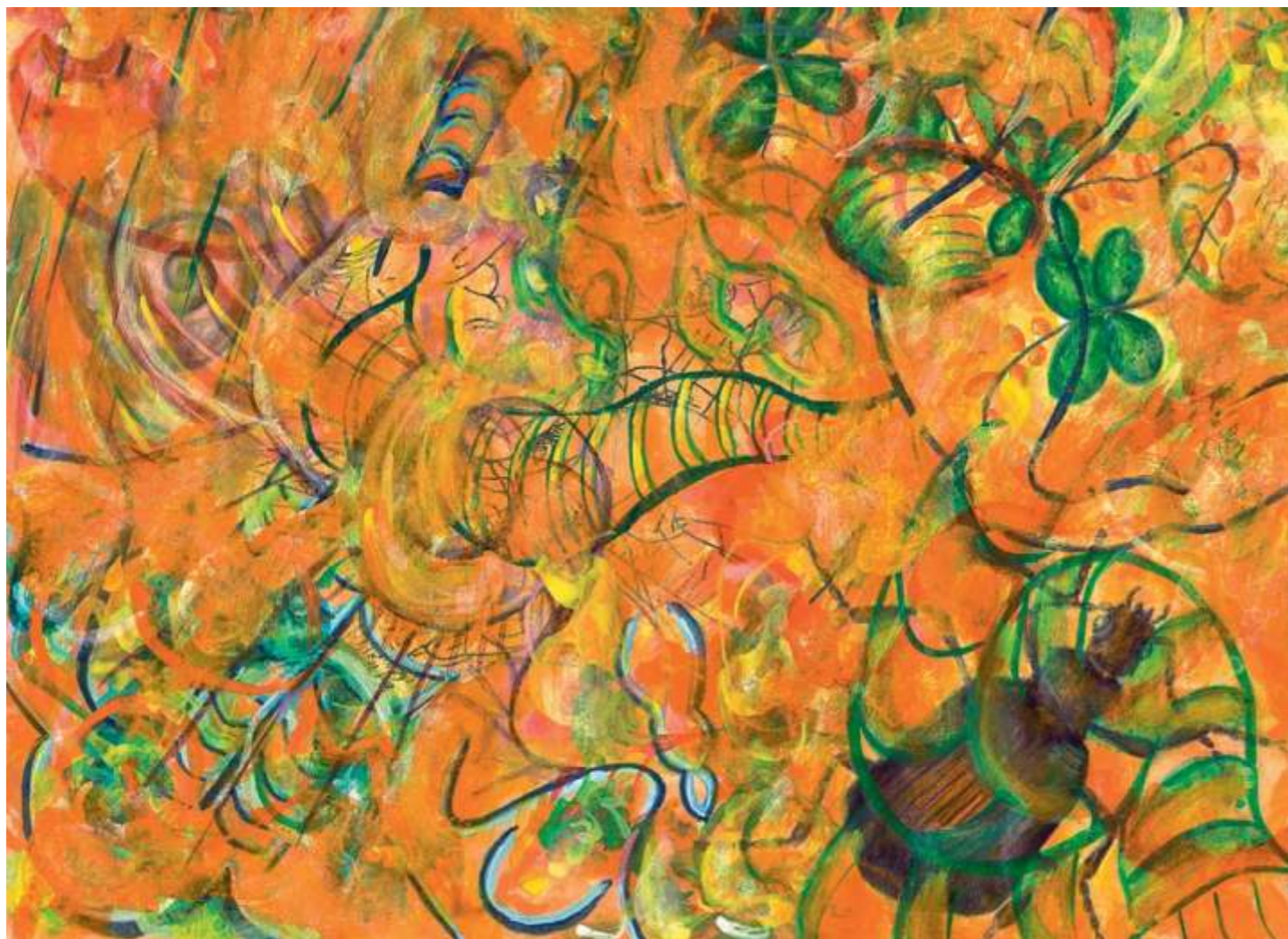
Beetle with Snail (Escarabajo con caracol), 2005. Acrílico sobre papel, 23 x 30.5 cm