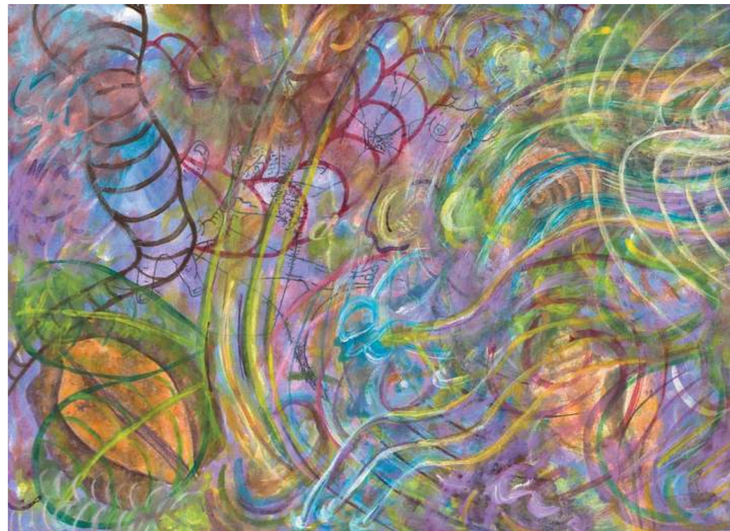
Whelks (Caracoles), 2005. Acrílico sobre papel, 23 x 30.5 cm