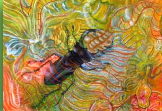
Detalle: The Eyes of a Stag Beetle (Los ojos del ciervo volante)

Nació en Tela, Honduras. Reside en los Estados Unidos desde 1965. Vive y trabaja en Nueva York.