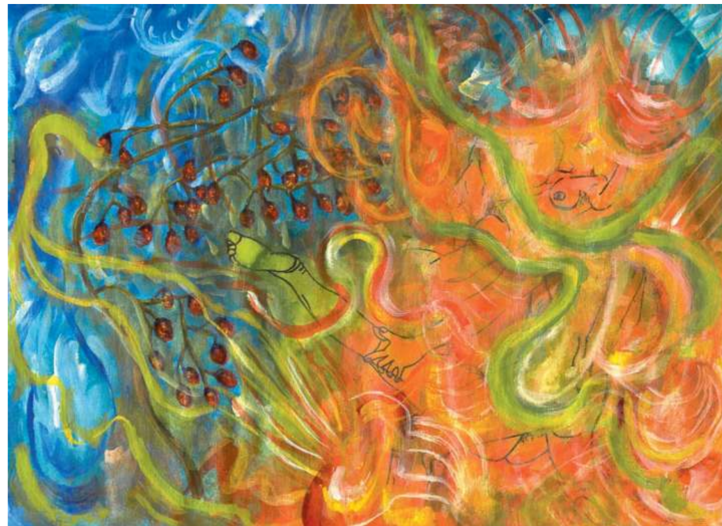
Eruption (Erupción), 2005. Acrílico sobre papel, 23 x 30.5 cm