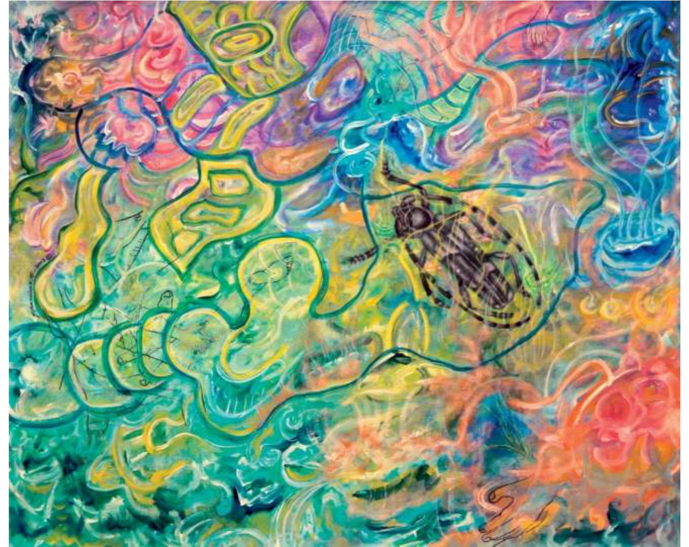
The Way of the Long-Horned Borer (El camino del escarabajo de largas antenas), 2005. Acrílico sobre tela, 124.5 x 152.4 cm