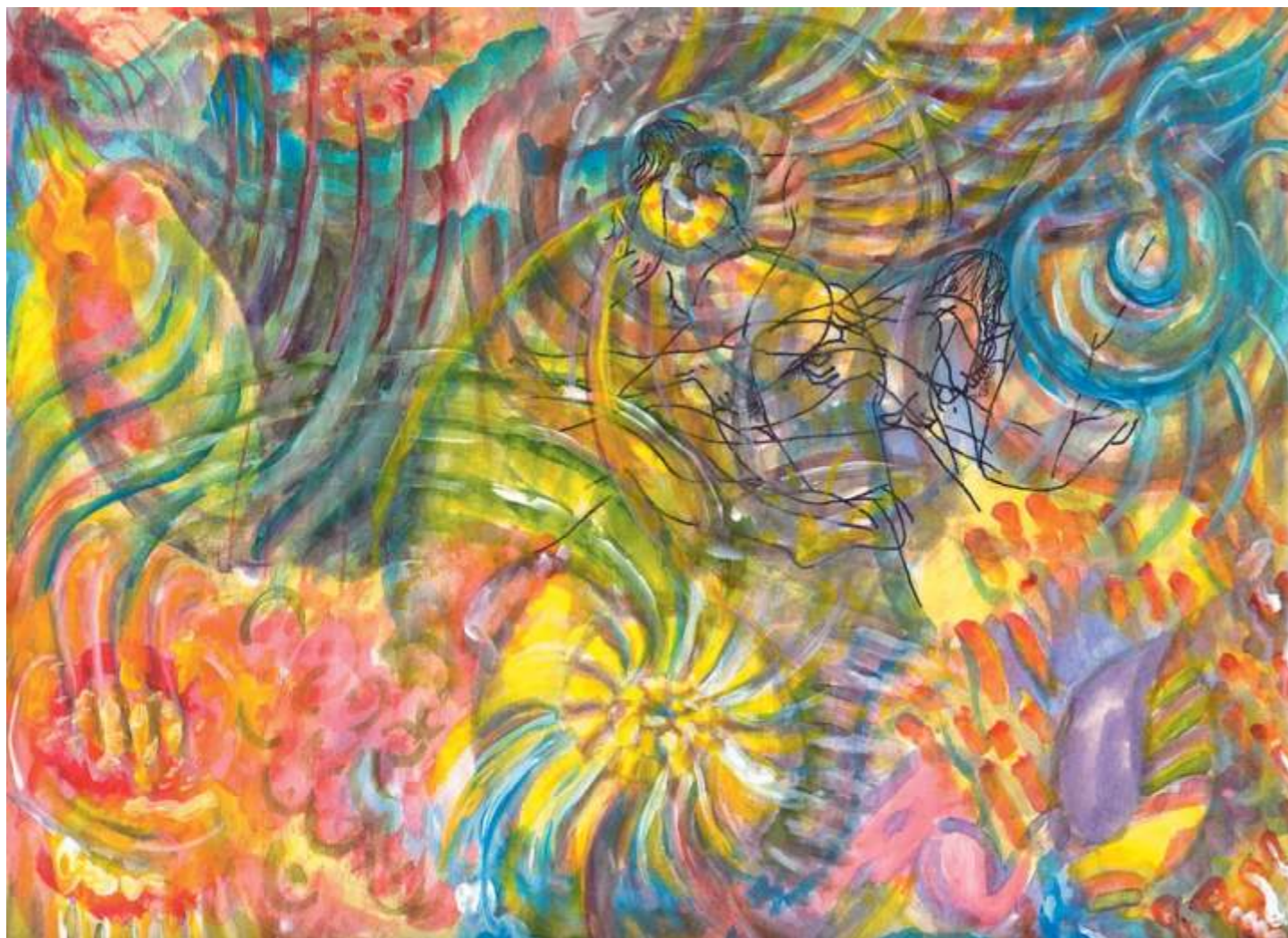
Seashells (Conchas marinas), 2004. Acrílico sobre papel, 23 x 30.5 cm