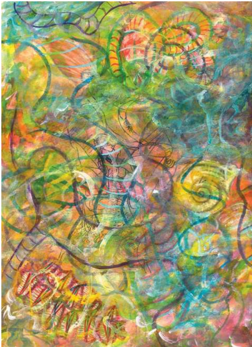
Mollusks (Moluscos), 2004. Acrílico sobre papel, 30.5 x 23 cm