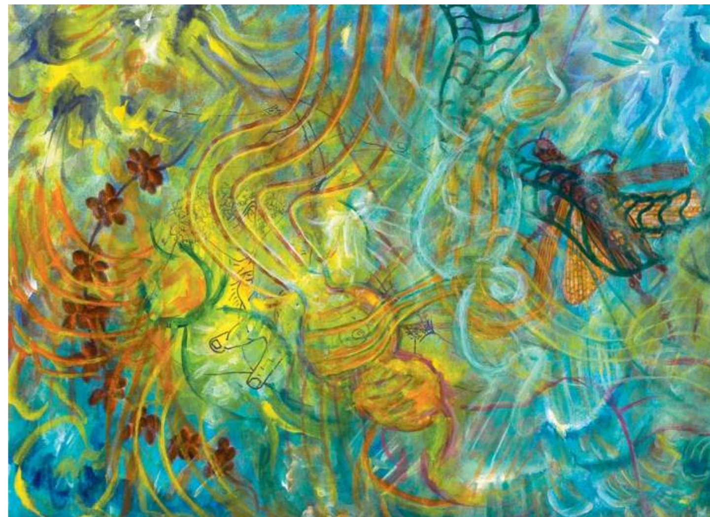
Mojácar's Grasshopper (Chapulín de Mojácar), 2005. Acrílico sobre papel, 23 x 30.5 cm