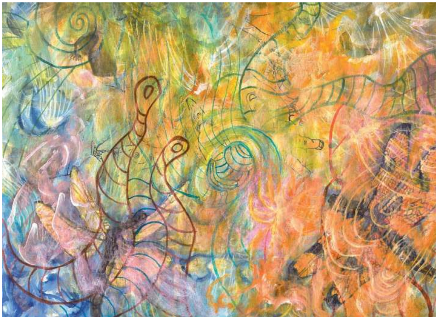
Dragonflies (Libélulas), 2005. Acrílico sobre papel, 23 x 30.5 cm