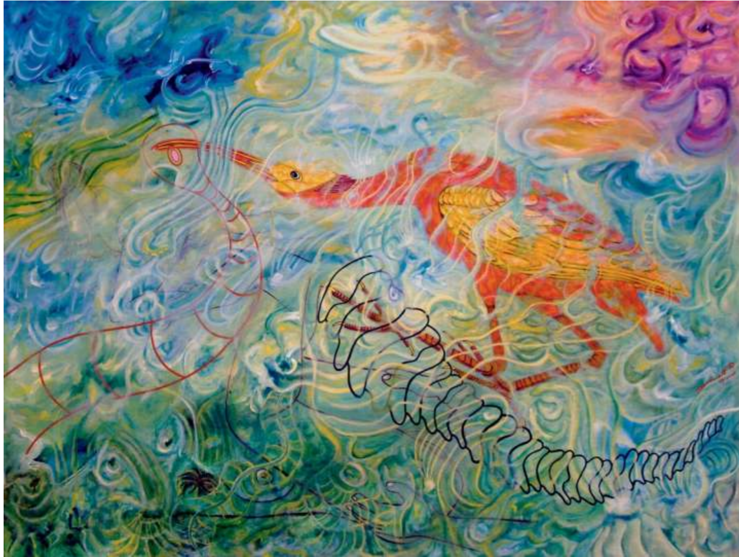
Glossy Ibis (Ibis brillante), 2005. Acrílico sobre tela, 112 x 152.4 cm