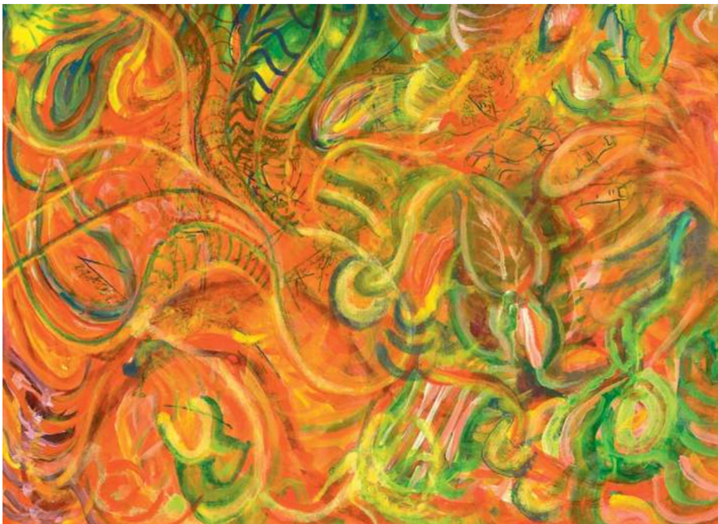
Flower Watch (Vigilia de flores), 2005. Acrílico sobre papel, 23 x 30.5 cm