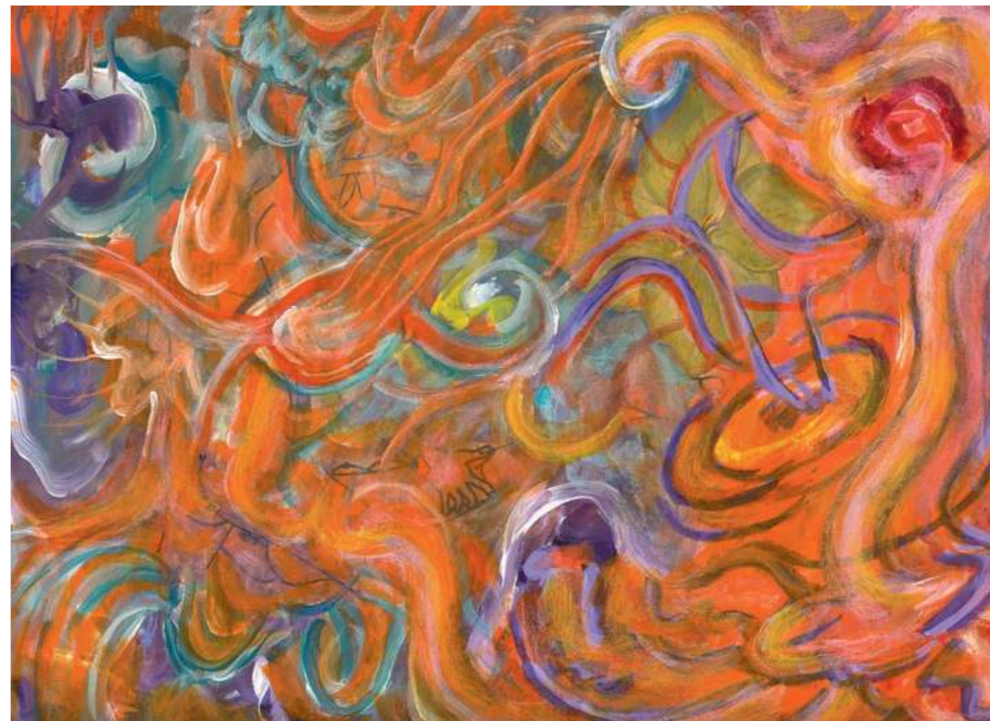
Hortensia (Hydrangea), 2005. Acrílico sobre papel, 23 x 30.5 cm