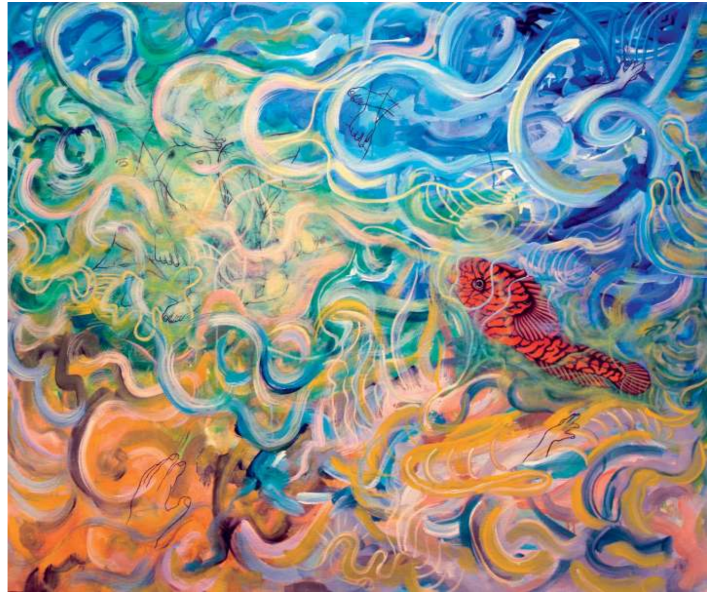
Northern Clingfish (Chupapedras norteño), 2005. Acrílico sobre tela, 119.5 x 145 cm