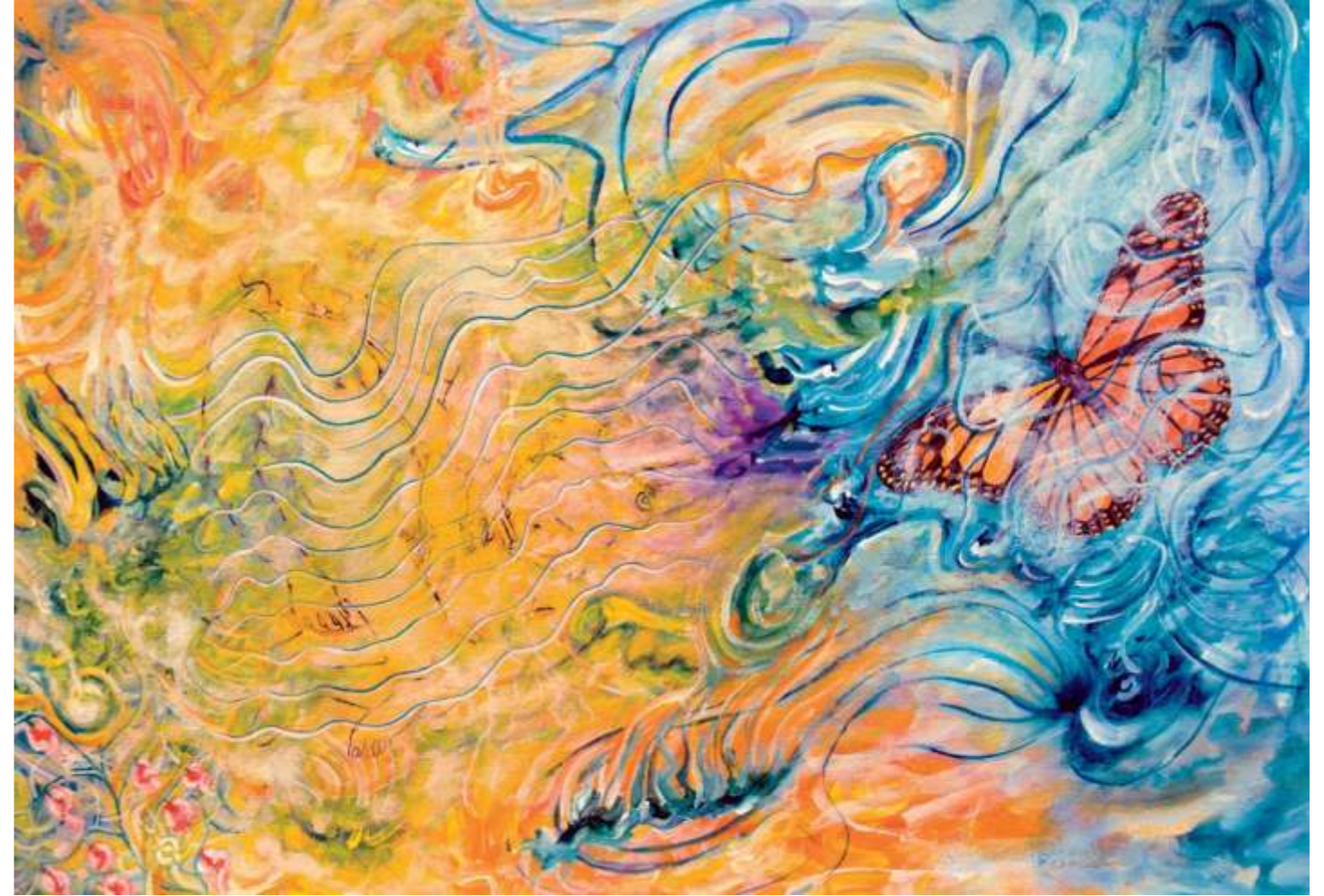
The Monarch; Love's Fire (La Monarca; fuego del amor), 2005. Acrílico sobre papel, 56 x 80 cm