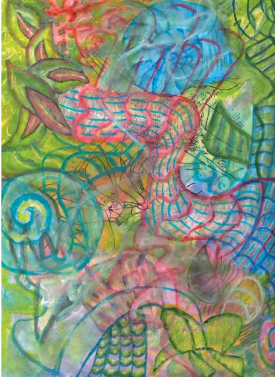
Snails and Peduncles (Caracoles y tallos), 2004. Acrílico sobre papel, 30.5 x 23 cm