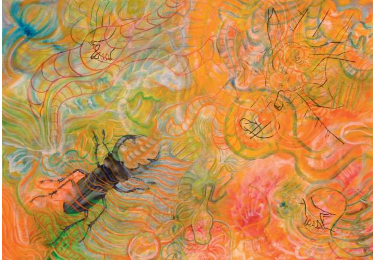
The Eyes of a Stag Beetle (Los ojos del ciervo volante), 2005. Acrílico sobre papel, 57 x 81 cm