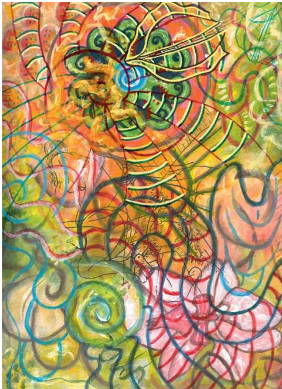
Bowl and Flowers (Tazón y flores), 2004. Acrílico sobre papel, 30.5 x 23 cm